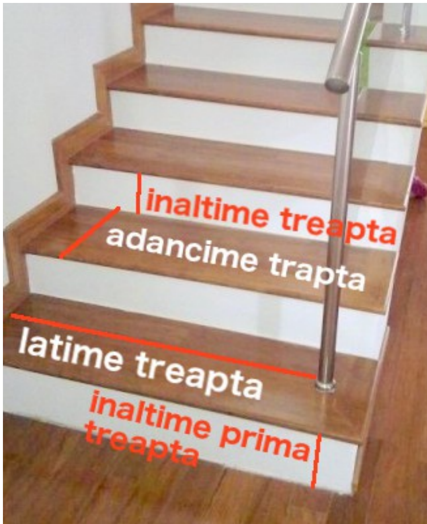
Podest de pauza la scara tip U